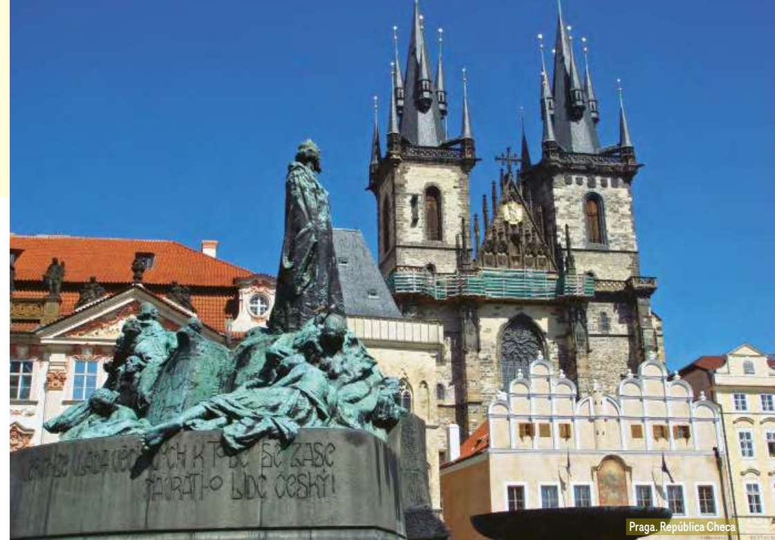
Praga. República Checa