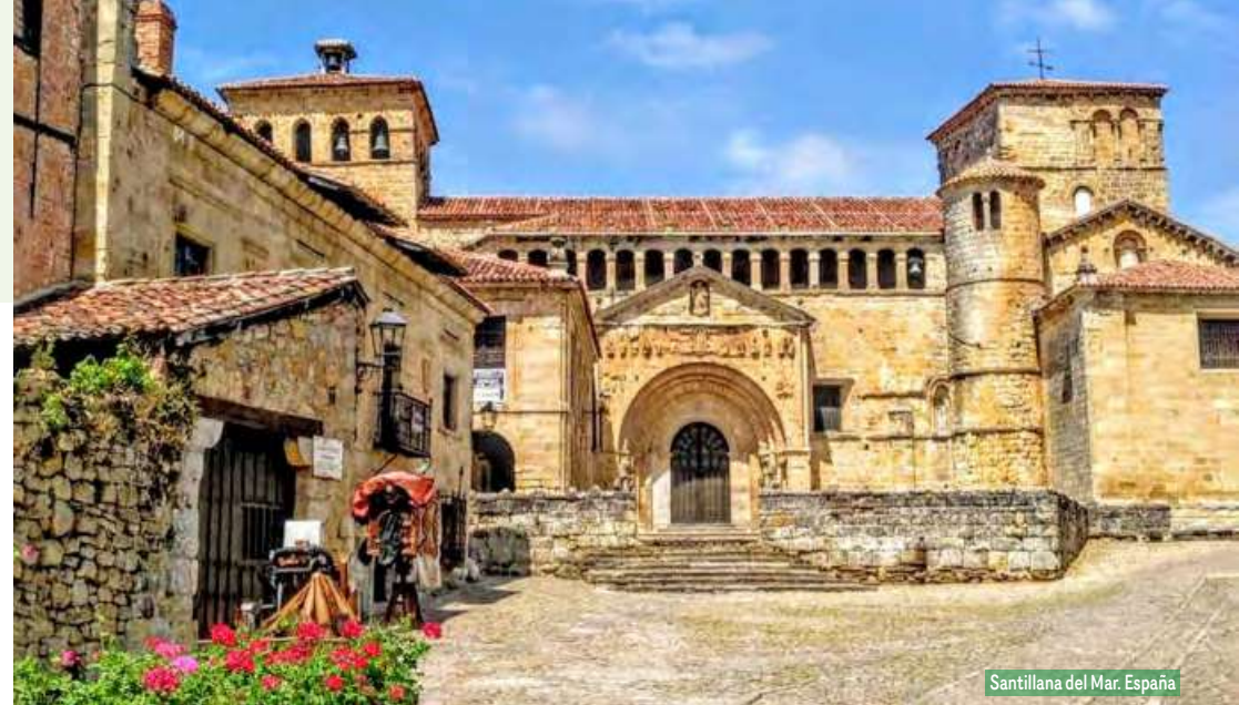
Santillana del Mar. España

Alojamiento y desayuno. Por la mañana visita panorámica de esta bella ciudad, situada en la desembocadura del río Tajo: Mirador del Parque, Plaza de Eduardo VII, Plaza del Rossio, Avenida da Liberdade, Barrio Madragoa (donde nació el Fado),