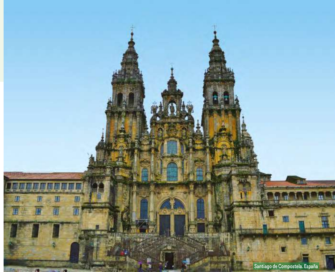
Santiago de Compostela. España

Desayuno y fin de los servicios. Puede ampliar su estancia en la capital de España.