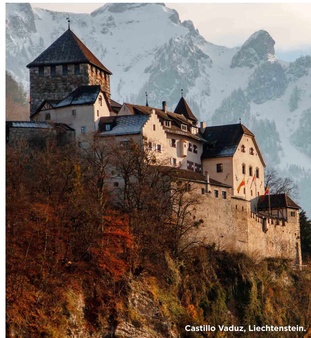
Castillo Vaduz, Liechtenstein.